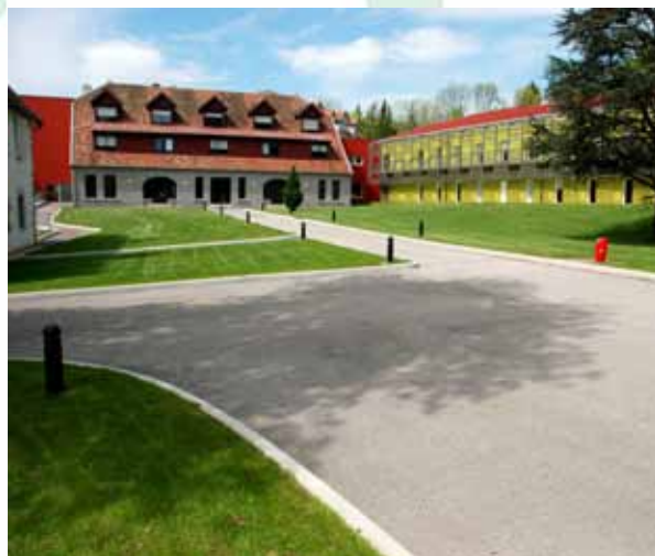
« La Grange-sur-le-Mont »