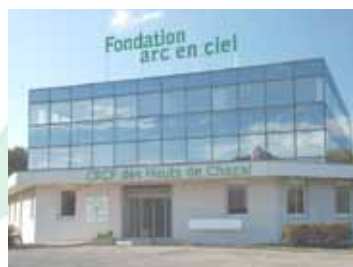
CRCP « Les Hauts de Chazal », Franois

BP 104 39110 Pont d'Héry Tél. 03 84 53 16 16 Fax 03 84 53 16 14 dir@crcpfc.fr www.fondation-arcenciel.fr