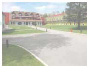
« La Grange-sur-le-Mont »

9 chemin des quatre journaux 25770 Besançon-Francois Tél. 03 81 41 80 68 Fax 03 81 41 86 68 ub@crpcfc.fr www.fondation-arcenciel.fr