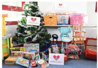
Direction Générale (25)