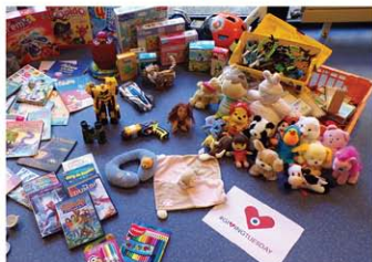
Résidence Surleau (25)