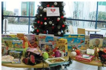
CMPR Bretegnier (70)