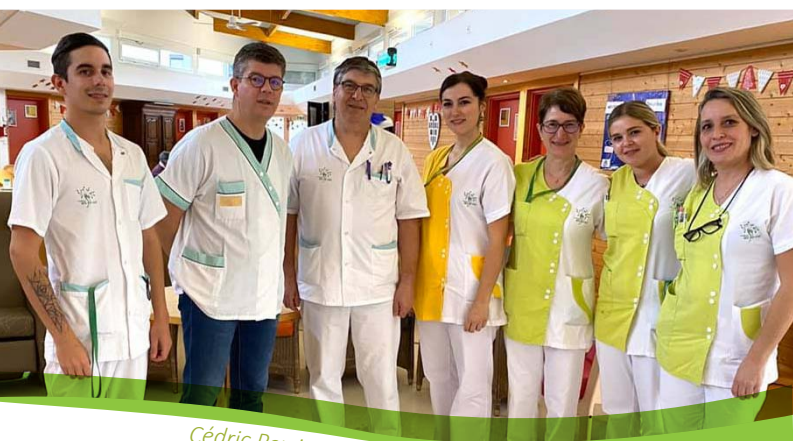
Cédric Perrin, sénateur, en compagnie de l'équipe soignante

La Fondation Arc-en-Ciel a eu le plaisir d'accueillir le Sénateur du Territoire de Belfort, Cédric Perrin, pour réaliser un "Vis ma Vie de soignant" dans notre EHPAD La Maison Blanche à Beaucourt (90).