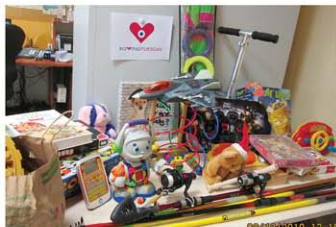
Clinique Médicale Brugnon Agache (70)

Du 18 novembre au 3 décembre 2019, salariés, patients, bénévoles et familles de la Fondation ont participé à une grande collecte de jouets au profit des enfants et adolescents des Instituts Perdrizet et Saint-Nicolas à Giromagny et Rougemont-le-Château (90).