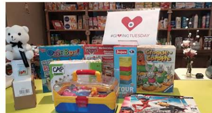
CRCP «La Grange-sur-le-Mont» (39)