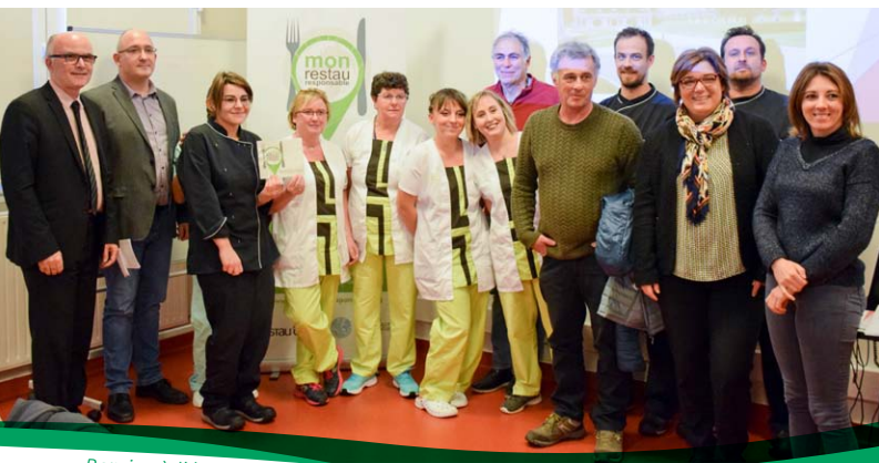
Remise à l'équipe du CRCP de Franche-Comté du label "Mon Restau Responsable"

Le Centre de Réadaptation Cardologique et Pneumologique "La Grange-sur-le-Mont" à Pont d'Héry (39) s'est lancé dans un projet de réduction du gaspillage alimentaire et de valorisation des déchets. Il obtient la garantie « Mon Restau Responsable » avec le soutien technique de Restau'Co.