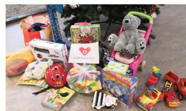
La Mosaïque (70)