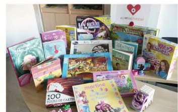
La Maison Blanche (90)

La Fondation Arc-en-Ciel s'est associée au mouvement mondial « Giving Tuesday », qui célèbre et encourage la générosité, l'engagement et la solidarité. Les jouets collectés ont été remis aux enfants au moment de Noël faisant de nombreux heureux.