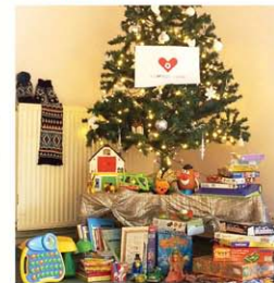
Résidence Les Vergers (90)