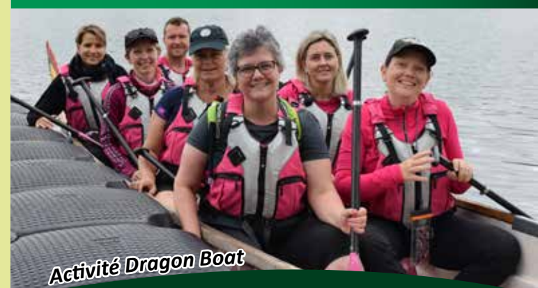
Activité Dragon Boat