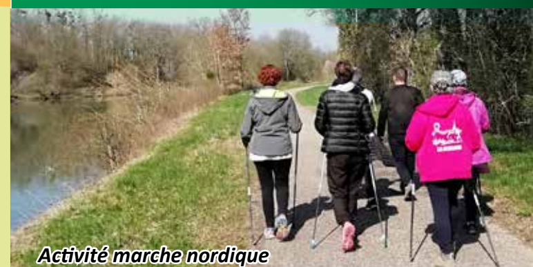
Activité marche nordique

Accompagnement de l'après traitement du Cancer